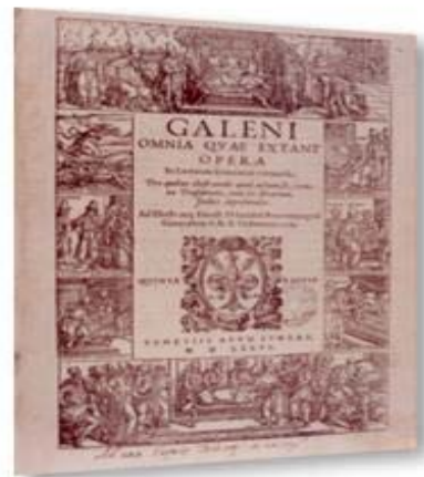
Galenus, Claudius Omnia quae extant opera in Latinum sermonem conversa. Quinta editio. Venetis, apud Iuntas, 1576-1577 13 vol. leg. 7, ill., fol.(37x24). Biblioteca medica collocazione: II.A. 9/15