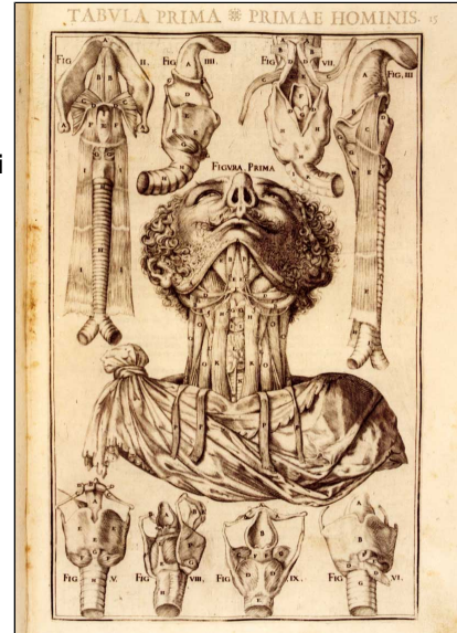
De vocis auditusque organis istoria anatomica. Ferrarie, excudebat Victorius Baldinus, 1601

Tutti i volumi sono stati catalogati e sono reperibili nell'Opac della Biblioteca.